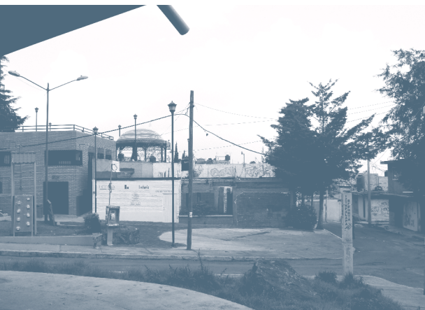
Complexo comunitário com biblioteca, sorveteria e centro de saúde, visto do domo